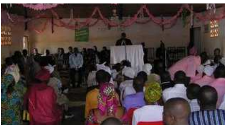
Gottesdienst in Nkoteng