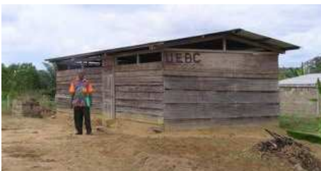
Gemeindehaus in Kribi