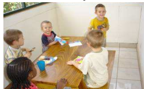
Ein paar der kleinen Gäste