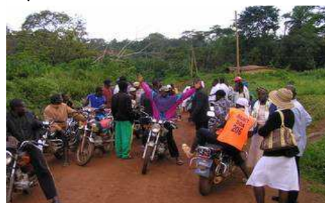
Mit 25 Motorradtaxen zur Taufstelle