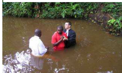
Bei der Taufe im Fluss