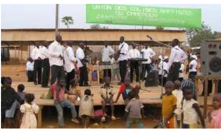
Jugendgruppe aus Yaoundé bei Einsatz in Nkoteng