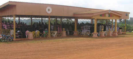
Festgottesdienst auf der städtischen Tribüne