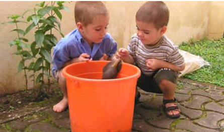
James, unser neues Haustier