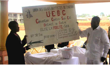
Das neue Hinweisschild zur Gemeinde in Soa