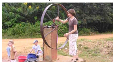
Am Brunnen vor dem Tore...