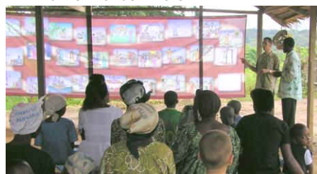
Bildertuch „Le chemin de Dieu“ im Einsatz