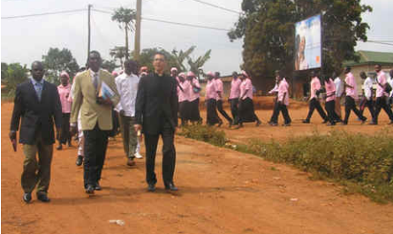
Auf dem Weg zum Gottesdienst