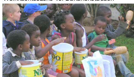
Kinder beim Singen