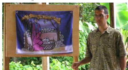
Weihnachtsszene vor Bananenstauden