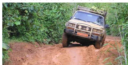
Geschüttelt – nicht gerührt...