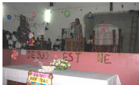
Weihnachtsdekoration in einer Gemeinde